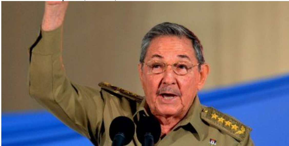
Raúl Castro, dirigente cubano.

Por: Redacción eltiempo.com | 6:21 a.m. | 26 de Octubre del 2010