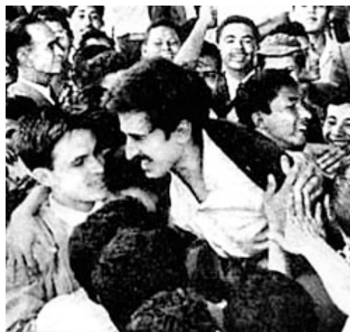
Roque Dalton abraza al poeta chileno Enrique Lihn