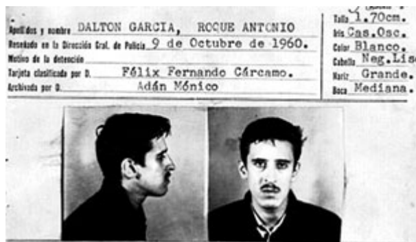
Fotos de la detención de Roque Dalton.

En 1970, Casa de las Américas vivía una hora complicada. Dalton explica en la carta que “de los catorce miembros del Comité original hay que decir que seis [habían] variado en sus posiciones o presentado puntos